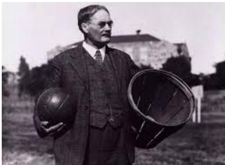
James Naismith o “pai” do basquete

O basquete foi criado na cidade de Springfield, Massachussets (Sim, a cidade dos Simpsons...) em 1891 por um professor de educação física canadense chamado James Naismith na associação crista de moços (YMCA). Durante um rigoroso inverno na cidade, ele precisava criar um esporte onde os participantes poderiam praticar em um espaço