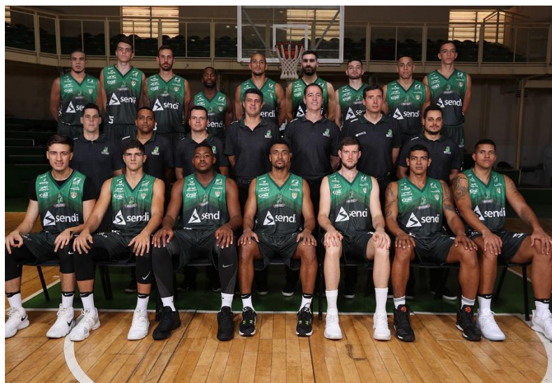
Equipe do Bauru Basket e sua delegação técnica

O Brasil tem uma liga muito competitiva chamada NBB (Novo Basquete Brasil), e a cidade de Bauru tem um time que sempre fica entre os principais times do país: o Bauru Basket, hoje uma das principais equipes da NBB que inclusive já foi campeã dessa competição.