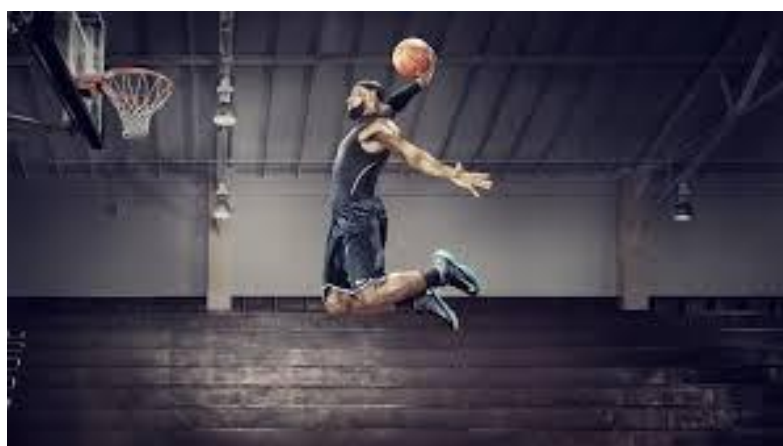
Lebron James , um dos principais atletas da NBA na atualidade.

Hoje o basquete é praticado no mundo todo, perdendo em popularidade apenas para o futebol, e sua principal liga é a liga norte americana chamada NBA (National Basketball Association). Liga essa que tem jogadores do mundo todo, inclusive já teve e tem excelente jogadores do Brasil. Na atualidade temos 4 brasileiros na NBA (Nenê Hilário, Cristiano Felicio, Raulzinho Neto e Bruno Caboclo)