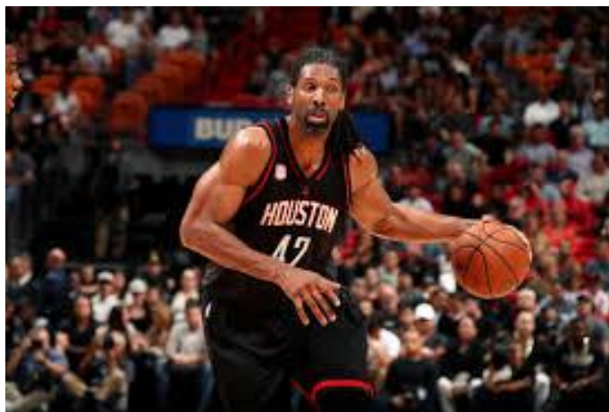
Nene Hilario, um dos representantes brasileiros na NBA.